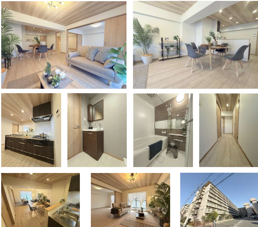
※現在、大規模修繕工事のため足場を設置しています。外観写真は工事前に撮影したものです。

『アースのリノベ』の公式Instagram instagram.com/earth_renovate